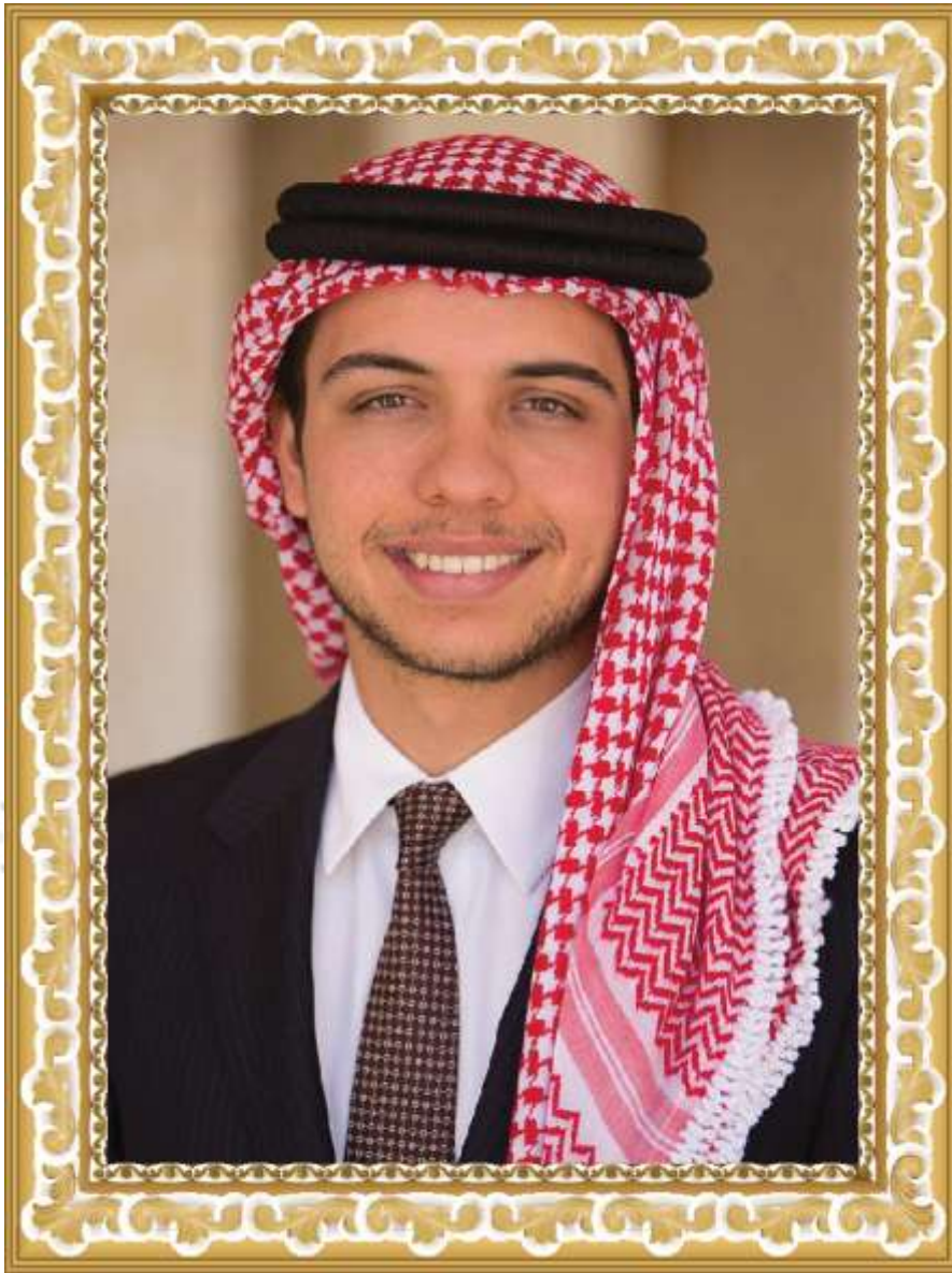
صاحب السمو الملكي الأمير الحسين بن عبدالله ولي العهد