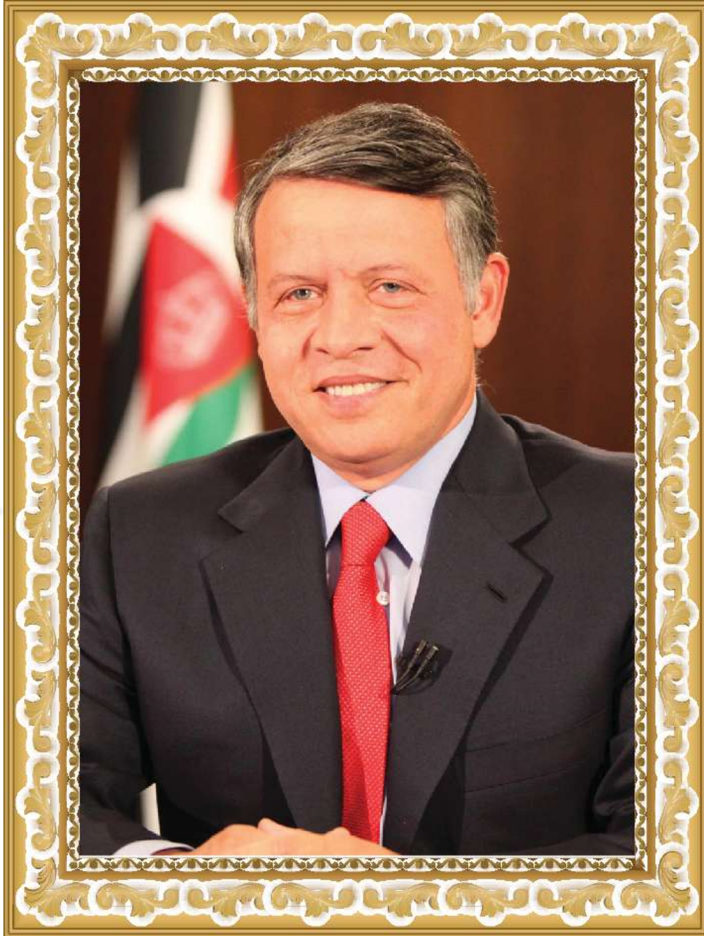
حضرة صاحب الجلالة الملك عبدالله بن الحسين المعظم